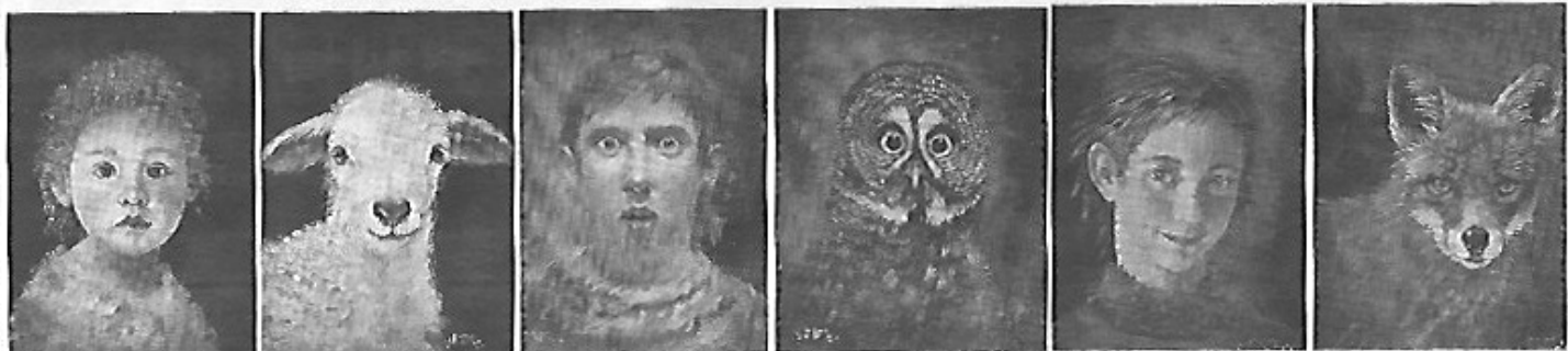
Comme une image vaut mille mots, voici quelques-unes des œuvres formant l'exposition Alter Ego , de Marie Montiel. Des toiles en duos qui dévoilent à quel point l'homme et l'animal peuvent partager les mêmes expressions, émotions et traits physiques.

pour parler de son approche. Pour participer, il faut réserver au 514-476-6331 ou à montielmarie@gmail.com . L'accès à la salle d'exposition est gratuit pour tous du lundi au vendredi, de 8 h 30 à 17 h, et le samedi et le dimanche, de 9 h à 17 h.